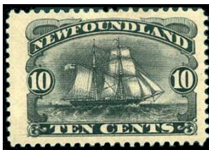
Obr. 4 Škuner