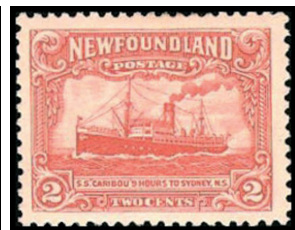
Obr. 16 Parník Caribow