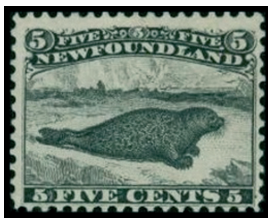
Obr. 3 Tuleň s tlapami (chyba)

Manželom kráľovnej Viktória sa začiatkom roku 1840 stal nemecký princ Albert z rodu Sachsen-Coburg-Gotha (CSG, Newfoundland 027; obr. 34), narodený v tom istom roku ako ona. Na rozdiel od nej mal