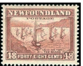
Obr. 22 Rybárska flotila