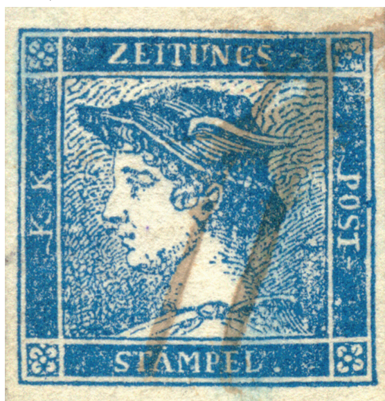
Obr. 2 Podtyp IIa znehodnotený škrtmi perom.

Myšlienka so zobrazením veľkých reprodukcí podtypov bola výborná, avšak narazila na problém: Kde získať reprodukciu najväčšieho podtypu IIa? Preto azda vzniklo šalamúnske riešenie uvedené v monografii, že zavedenie podtypu IIa Müllerom [1] sa nepotvrdilo. Na obr. 1 je zväčšená reprodukcia časti známky podtypu IIa zoskenovanej priamo z originálneho vydania Müllerovej publikácie [1]. Škoda iba, že