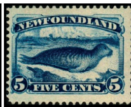
Obr. 6 Tuleň s plutvami