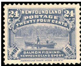
Obr. 13 Lov lososov