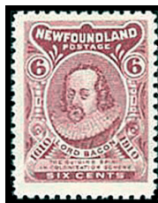
Obr. 14 F. Bacon