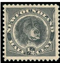
Obr. 5 Newf. pes