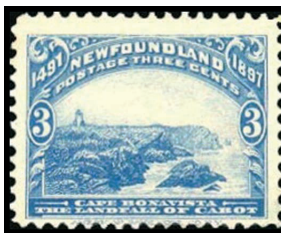
Obr. 8 Mys Bonavista