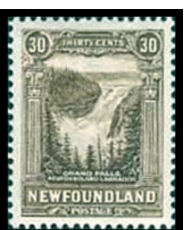
Obr. 21 Vodopády