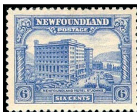
Obr. 18 Hotel St. John