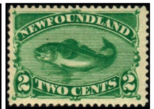
Obr. 7 Treska