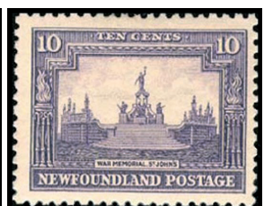
Obr. 19 Pamätník vojny