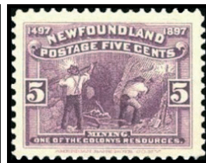
Obr. 9 Baníctvo