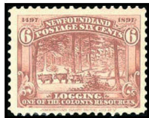
Obr. 10 Ťažba dreva