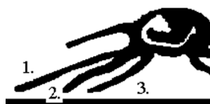
Obr. 3 Číslovanie záhybov pod sponou.

Doposiaľ používané rozlišovanie jednotlivých podtypov bolo založené hlavne na odlišnom tvare písmen v nadpise ZEITUNGS , v texte STÄMPEL v dolnej časti známky, ďalej na poškodení kresby ľavej hornej rozety, škrvne na nose („bradavici“) a škrvne na brade. Uvedené texty sú na známke zobrazené v negatíve a vzhľadom na použitú metódu prípravy tlačových štočkov sú vyhotovené v horšej kvalite. Prvé tlačové dosky sa veľmi rýchlo opotrebovali a pri príprave nových dosiek dochádzalo postupne k úprave tlačových štočkov a čiastočnému vylepšovaniu tlače textov. Takže išlo o vynútené úpravy s cieľom zlepšiť kvalitu tlače. Niekedy k zásadným objavom vedie veľká náhoda a dosť klukatá cesta. Dostalo sa mi do zbierky celkom podarené falzum tmavomodrého Merkura (nie najlepšia reprodukcia známky na eBay) a pri porovnávaní s originálnymi známkami som zistil, že falzifikátor najmenej pozornosti venoval trom záhybom pláštá modrého Merkura pod okrúhlu sponou. V porovnaní s typom I bola odchýlka kresby veľká. Neskôr som sa k tomuto falzu vrátil znova ale v porovnaní s typom III bola odchýlka podstatne menšia. Heuréka !!! Číže existuje asi ďalší rozpoznávací znak jednotlivých typov a podtypov. Po preštudovaní celej mojej zbierky musím konštatovať, že skutočne existuje rozlišovací