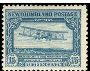
Obr. 20 Dvojplôšník Vickers Vimy