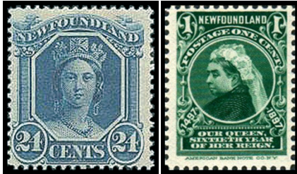
Obr. 1 a 2 Kráľovná Viktória (1865, 1897).

Kráľovná Viktória (CSG al , Newfoundland 030, 066; obr. 1 a 2) sa narodila 24. mája 1819. Osud si ju vybral, a tak roku 1837 nastúpila po Viliamovi IV. na anglický trón. V čase jej korunovácie, v júni roku 1838, poštové známky ešte neexistovali. Prvá známka „Black penny“ bola vydaná až 6. mája 1840. Známková tvorba Veľkej Británie a skoro všetkých jej domínií a kolónií bola od začiatku z hľadiska obrazu známk dlhé roky dosť stereotypná. V samotnej Veľkej Británii bol v celej dobe panovania kráľovnej Viktória jediným námetom poštových známk jej rôznym spôsobom štylizovaný profil. Žila a panovala až do roku 1901. Aj potom