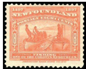
Obr. 11 Rybolov