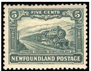
Obr. 17 Expresný vlak