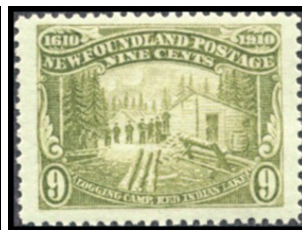
Obr. 15 Tábor drevorúbačov