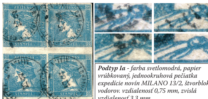
Podtyp Ia - farba svetlomodrá, papier vrúbkovaný, jedookruhová pečiatka expedície novin MILANO 13/2, štvorblok, vodorov. vzdialenosť 0,75 mm, zvislá vzdialenosť 3,3 mm