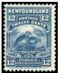
Obr. 12 Tetrovy